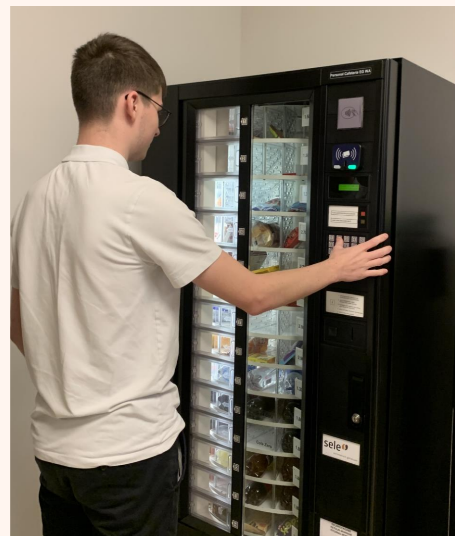
Bild vom Automaten, den wir momentan haben

Mit unserem Projekt können wir den LLB-Mitarbeiter eine Freude machen. Sie können die regionalen Produkte mit nach Hause nehmen und tun zudem noch etwas Gutes für die Umwelt. Wir freuen uns, das Projekt weiterzugeben und auf die weitere Organisation und Verwaltung des Automaten.